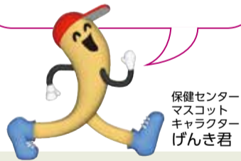
保健センター マスコット キャラクター げんき君

検診を受けたいと思っても、わからないことや不安がありますよね? 胃がん・大腸がん検診についてQ&Aでお答えします。 わからないことは保健センターへお気軽に電話してくださいね。